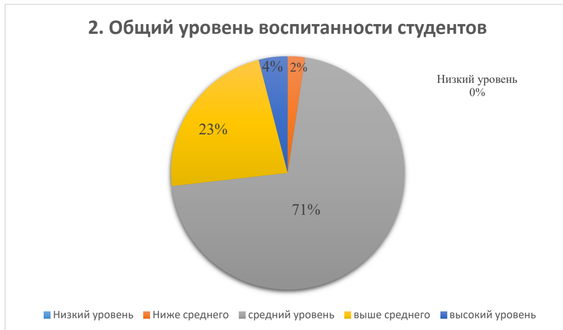
Рис. 2. Общий уровень воспитанности студентов